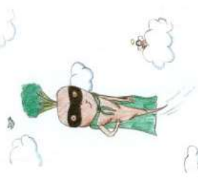
Viktorija, 10 Jahre