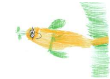
Cosima, 5 Jahre