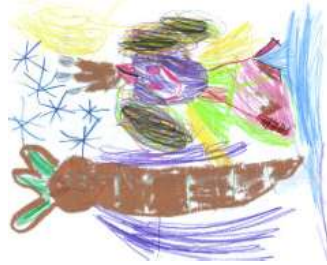
Josefine, 5 Jahre