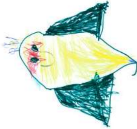
Valentin, 4 Jahre