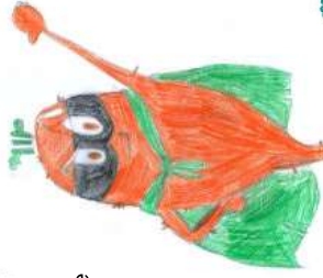
Mela, 7 Jahre