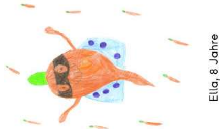
Ella, 8 Jahre