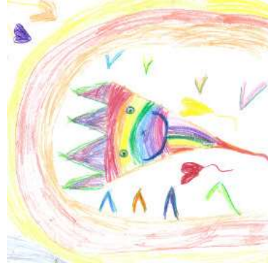
Pia, 5 Jahre