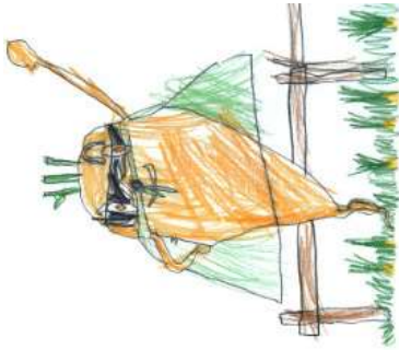
Fridolin, 5 Jahre