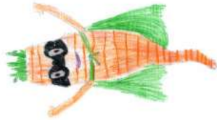
Lola, 10 Jahre